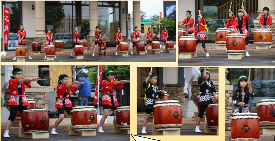
心を一つに、気合いマックス！！

7月1日（土）に東川町慰霊祭行事協賛音楽行進が行われました。小雨の中でしたが、今年度最初の「一小太鼓」の発表に、子供たちは緊張しながらも、元気いっぱい、集中して最後までやり遂げることができました。法被やはちまき、足袋を身に付け、たくさんのお客さんを前に、太鼓の音を響かせていました。